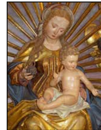
Pacher Madonna (1498)